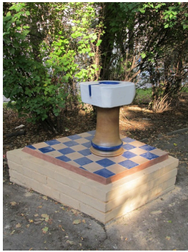
Pítko pro ptáky