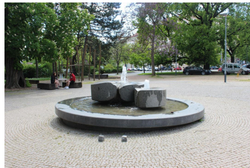
Fontána v parku