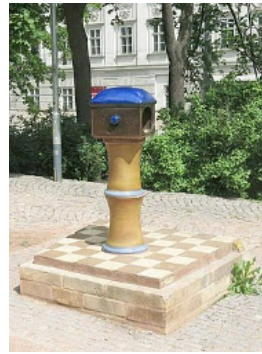
Krmítko pro ptáky